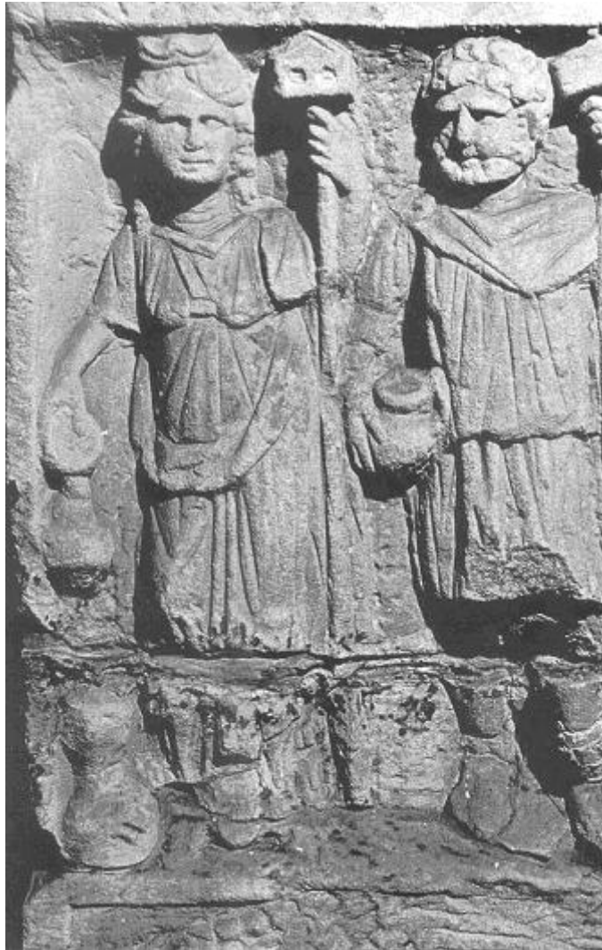
Un Dieu au marteau accompagné d'une Déesse au marteau à tête de maison. Bas relief 'Germano-Romain' (Musée de la Cour d'Or, Metz).